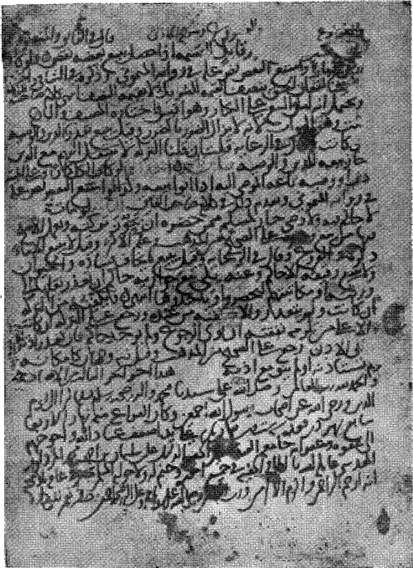
الصفحة الأخيرة من الجزء الثالث الذي بخط المصنف وبها انتهى القسم الذي كان بخط المصنف